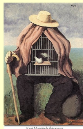
René Magritte le thérapeute

Le Groupe Régional Franche-Comté de la Convention Psychanalytique vous propose, depuis 2018, une série de présentations d'ouvrages en compagnie de leurs auteurs. Le mode privilégié sera celui du témoignage, qui seul rend compte de la vérité d'un sujet à travers son énonciation singulière. Après une présentation du livre par son auteur, une discussion s'engagera avec les participants et le soutien des membres du GRFCCP.